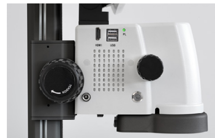
Ruota Zoom con integrato click-stop